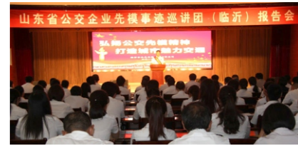
次报告会为契机，做好“敬劳模、学劳模、争做劳模”的创先争优活动，在公交系统内，发现、培养品质好、技术硬、服务周的先进人物，树立典型，发挥劳模的榜样带头作用，为全市交通发展和大美临沂城的建设不断注入更多新的活力。（工会）

集团公司历来重视先进人物的选树，这次公交兄弟单位的劳模同志们来到集团公司作报告，为我们“传经送宝”，传授先进的工作方法和经验，讲述他们的感人事迹，对于我们是一个十分难得的学习机会，对于广大干部职工进一步解放思想、与时俱进、扎实工作、促进公交快速发展具有十分重要的意义。集团公司将以本