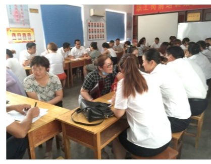
希望以后公司能够多多开展这样的活动。一对一的情绪疏导不但针对性强，而且达到了洗涤心灵的效果，让员工真正做到了放松心情，学会了自我解压，让心灵时刻充满着温暖和阳光。（企业发展部）

近年来，随着人们精神压力的不断增大，公司员工在思想动态上出现了一些新情况、新变化，使传统的思想政治工作面临着新的挑战。为了使大家能够自如地应对工作中遇到的压力，从而乐观积极地工作，7月28日下午，集团公司政治辅导员以2人一组，共分20组对票务管理部40余名员工进行了一对一的情绪疏导。活动中，政治辅导员通过倾听员工的心声，充分走进每一个人的内心世界，站在对方的角度分析、了解压力产生的来源，告知员工应当如何进行自我调节，卸下压力的重担。政治辅导员的分析方法，让员工们知道如何不把压力变成负面情绪，怎样通过正确的方法和渠道来疏通和缓解情绪的负面因素，增加人生快乐的正能量。票务管理部的员工们纷纷表示，