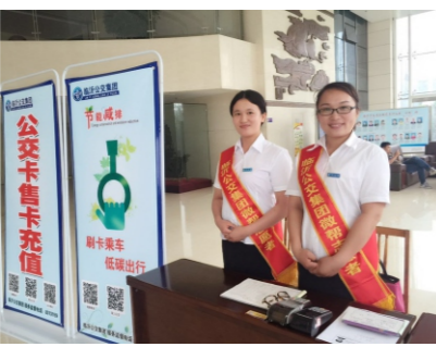
市民的身边。（通卡公司）

为更好地满足广大市民办理公交IC卡的需求，倡导刷卡乘车，低碳出行。今年以来临沂公交集团微帮志愿者们先后走进临沂市罗庄区政府、临沂市检察院、临沂市看守所等20余家单位开展志愿便民服务，除了在现场集中办理公交IC卡外，还为办公人员热心解答了老年卡办理、学生卡审核等公交卡业务上的问题。活动大大节省了用卡人员的时间，受到了办公人员的一致好评。接下来，志愿者们还将继续走进各大企业、学校、热点站牌，努力将便捷的服务送到每一位