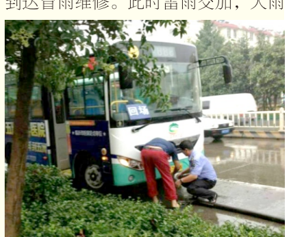
倾盆，路面已经积满雨水，维修人员不时钻入车底，或淋着雨水排除车辆故障。等到车辆维修完成后，修理厂的衣服也早已被雨水湿透了。（北城修厂）

护航平安公交 2016年8月，一场暴雨突袭了临沂，一辆57路公交车因故障在路上抛锚。在接到报修电话后，修理厂快速到达冒雨维修。此时雷雨交加，大雨