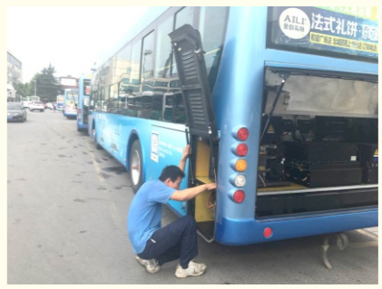
技术状况良好，并对场站内防汛物资进行重新整理，做到有备无患，牢牢把握汛期的主动权。（电车公司）

确保防汛工作万无一失 三公司所属路段积水经常淹没车胎，给车辆安全运营尤其是新能源车带来较大安全隐患。由于68路途经路段积水较深，汛期68路的驾驶员们经常检查电机机是否是否正常、车辆电瓶是否进水，以确保车辆状况正常，保障安全运营。同时，三公司通过悬挂条幅、宣传栏、公司政务网站、内刊等多种方式，加强对驾驶员汛期安全生产教育，认真贯彻落实“安全第一、预防为主、防重于抢、有备无患”的方针，提高安全驾驶运营技能和应对突发险情时的处置能力。（三公司）