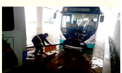
水熄火，现场情况紧急需要救援。二修厂立即组织抢险修理人员、防汛抢险人员、拖车人员以最快速度赶赴现场抢险。（二修厂）

冒雨作业 奋勇抢险 8月8号早晨突降暴雨，二修厂接80路队长电话，该线路运营车辆鲁Q8517N在临沂五路与金五路桥下遇大