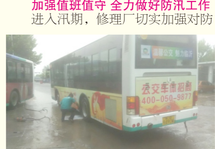
加强值班值守 全力做好防汛工作 进入汛期，修理厂切实加强了对防汛工作的领导，强化责任意识，确保各项防汛措施落到实处。在做好日常维修的同时对防汛车辆、物资进行检查。制定了防汛应急预案，健全部门联动机制，加强部门之间的协调与配合。严格落实汛期值班制度，制定值班表，保证24小时值班，明确专人负责，并设立专门的值班记录，加强对重点区域的巡查，确保及早做好防范，及时发现灾情。同时加强宣传教育，不断提升职工的防灾意识和自救能力，做到及时避险。要配备足应急物资装备，组织精干的抢险队伍，加强应急演练，全力做好汛期的各项安全生产工作。（大修厂）

按防汛预案的要求，科学地进行了安排。形成了防汛抢险的合理调配资源，完成了在最短时间内消除险情的防汛目标。通过此次演练，提高了一修厂职工防汛抢险意识，检验了各职能组之间的协调作战能力，各职能组之间，通过方案制定、指挥调度、防汛组织、后勤保障等各项防汛工作的配合，提高了协同作战能力。同时检验了我们的职工队伍坚守岗位、严格纪律、紧张有序的工作。（一修厂）