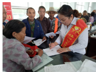
方城镇交管所开展公交上门服务活动