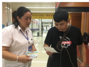
联合支付宝开展“1分钱乘车活动”