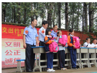
临沂公交车公司走进沙沟小学开展“公交宣传周 安全进校园”活动