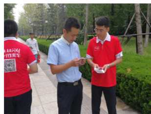
银联支付1分钱乘车宣传活动