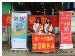
志愿者向广大市民宣传公交出行理念