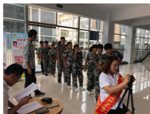
微帮志愿者走进临沂市第32中学