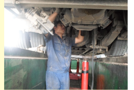
交车辆的安全运营,为广大乘客提供了一个安全快捷的出行环境。(北城修理厂)

为保证公交车辆的正常运营,国庆期间,北城修理厂加强安全管控,提高车辆维修率,为节日期间运行车辆提供了保障。节日期间,值班领导始终值守在现场监督检查,抽查了千斤顶、安全凳、维修工具的使用,保障了维修工具的正常使用。抢修车辆与抢修人员严阵以待,接到外出抢修电话,以最快速度出发,保质保量地完成抢修任务。进厂维修的车辆认真检查安全技术状况,及时协调解决修理中存在的技术、材料供应等问题,有效保障了车辆的正常运营。国庆期间,北城修理厂累计维修车辆91台次,外出抢修21台次,确保了公