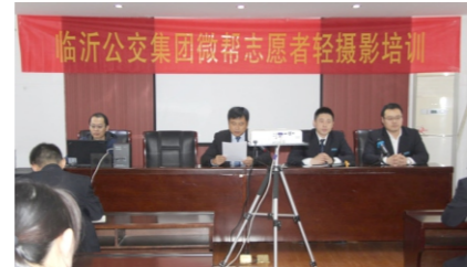
公司新闻宣传工作做出更大的贡献。(通卡公司 新闻宣传部)

通过此次培训丰富了大家的摄影知识,激发了大家的摄影热情,提升了各基层通讯员和一线窗口服务人员的摄影水平。大家纷纷表示这节课受益匪浅。今后要多观察、勤思考、随时拍、巧立意,充分利用新闻图片在宣传中的优势,以更高的标准为集团